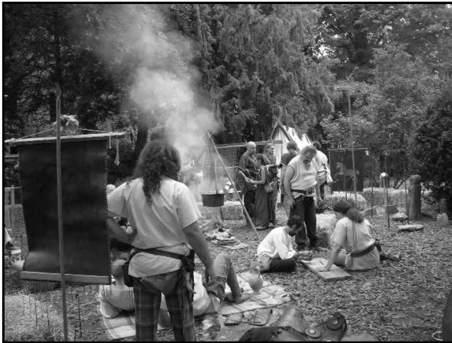
(Taurino Brigas 2006 – Pecetto Torinese)

Unsere Tätigkeiten sind sowohl praktisch – dokumentierte Rekonstruktion von Kleidung, Waffen, Handwerkprodukte, Essen und Getränke, die wir dann verwenden bzw. verbrauchen anlässlich der Historiendarstellungen; Teilnahme an keltischen Festivals und Treffen, Montage und Wohnen in unseren Campingzelten und Durchführung von Kampfsimulationen – und theoretisch – wir halten Konferenzen, wir besuchen Ausstellungen und verfassen Artikel für fachspezifische Publikationen. Die praktischen Tätigkeiten bestehen vor allem in der genauen Rekonstruktion von archäologischen Funden, d.h. von Gegenständen, die in der Eisenzeit üblicherweise zum Einsatz kamen. Damit die Rekonstruktion wirklich geschichtstreu ist, haben wir auch die damalige Werkzeuge und Abläufe wieder zum Leben gebracht; die oben erwähnten Tätigkeiten werden auch während der historischen Veranstaltungen durchgeführt. Eine der handwerkliche Ausführungen, die wir realisieren, ist die Herstellung von Kettenhemden – Rüstungen, die von den keltischen Kämpfern getragen wurden. Diese Zeugnisse sind 100% handgeflochten, Ring nach Ring.