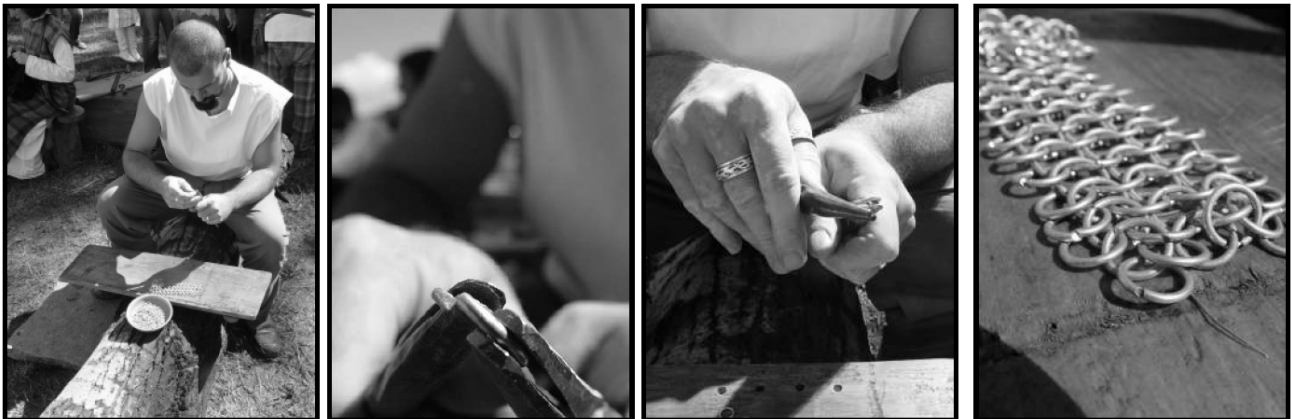
(Magiaceltica 2006 – Trentino)

Unsere Tätigkeiten sind sowohl praktisch – dokumentierte Rekonstruktion von Kleidung, Waffen, Handwerkprodukte, Essen und Getränke, die wir dann verwenden bzw. verbrauchen anlässlich der Historiendarstellungen; Teilnahme an keltischen Festivals und Treffen, Montage und Wohnen in unseren Campingzelten und Durchführung von Kampfsimulationen – und theoretisch – wir halten Konferenzen, wir besuchen Ausstellungen und verfassen Artikel für fachspezifische Publikationen. Die praktischen Tätigkeiten bestehen vor allem in der genauen Rekonstruktion von archäologischen Funden, d.h. von Gegenständen, die in der Eisenzeit üblicherweise zum Einsatz kamen. Damit die Rekonstruktion wirklich geschichtstreu ist, haben wir auch die damalige Werkzeuge und Abläufe wieder zum Leben gebracht; die oben erwähnten Tätigkeiten werden auch während der historischen Veranstaltungen durchgeführt. Eine der handwerkliche Ausführungen, die wir realisieren, ist die Herstellung von Kettenhemden – Rüstungen, die von den keltischen Kämpfern getragen wurden. Diese Zeugnisse sind 100% handgeflochten, Ring nach Ring.