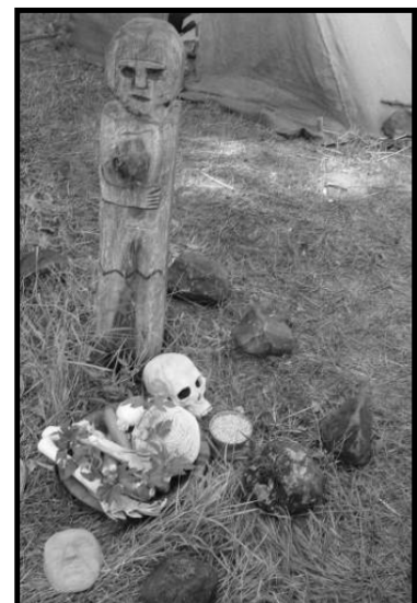
(Magiaceltica 2006 - Trentino)