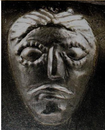
Testine delle fàlere di Manerbio (BS), I secolo a.C.