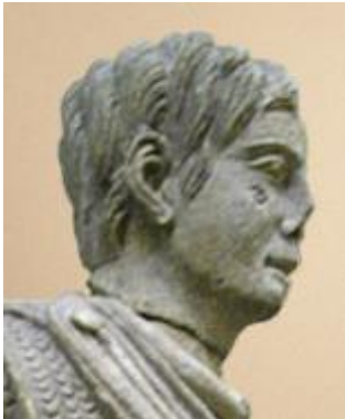
il guerriero (romanizzato) di Vachères (Francia, I secolo a.C.),

In alcune raffigurazioni, infine, compaiono pettinature assolutamente “normali”, che nessuno noterebbe negli uffici delle nostre città. Ne sono esempi: