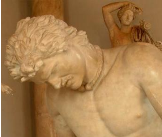
Galata morente (Asia Minore, fine III secolo a.C.): evidenti le grandi ciocche di aspetto spesso e rigido.