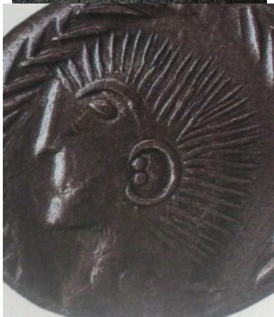
Moneta dei Boi (Slovacchia, I secolo a.C.).