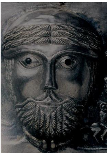
Divinità maschile dal calderone di Gundestrup