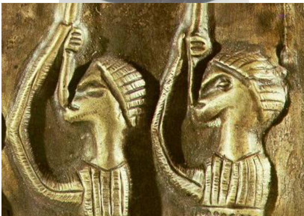
Guerrieri dal calderone di Gundestrup (Danimarca, I secolo a.C.; probabile provenienza dal Territorio degli Scordisci).