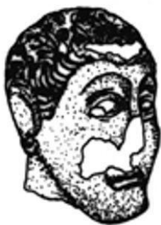
una testa di Entremont (Francia, inizi II secolo a.C.), molto influenzata dalla scultura greca,