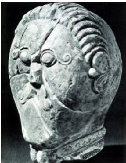
Testa di Msecke Zehrovice (Rep.Ceca) III-I a.C.

Alcune raffigurazioni, non molto naturalistiche, sembrano rappresentare personaggi con una fascia di capelli sulla fronte e il resto della testa rasato. Si è ipotizzato che questa "tonsura" potesse essere un attributo divino o sacerdotale.