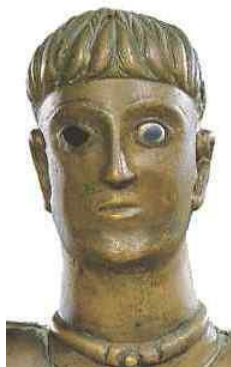
una divinità da Bouray-sur-Juine (Francia), I a.C.,